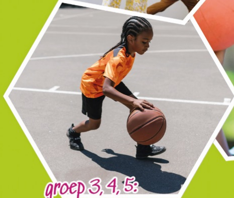
groep 3, 4, 5: Basketbal