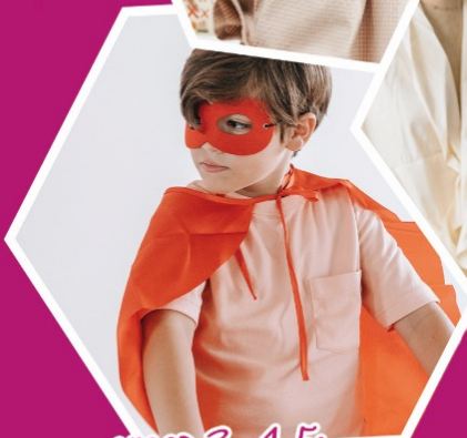
groep 3, 4, 5: Ik speel toneel