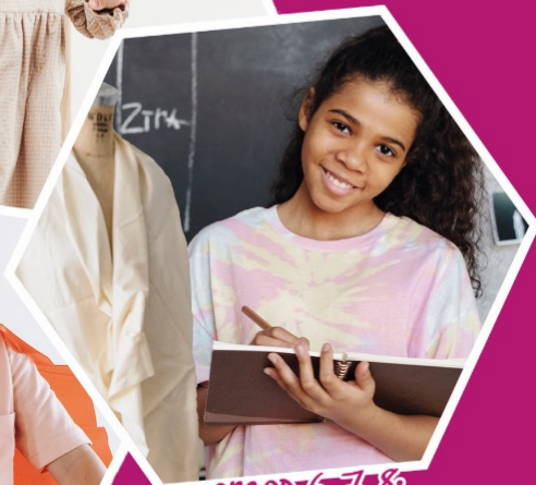
groep 6, 7, 8: Mode ontwerpen