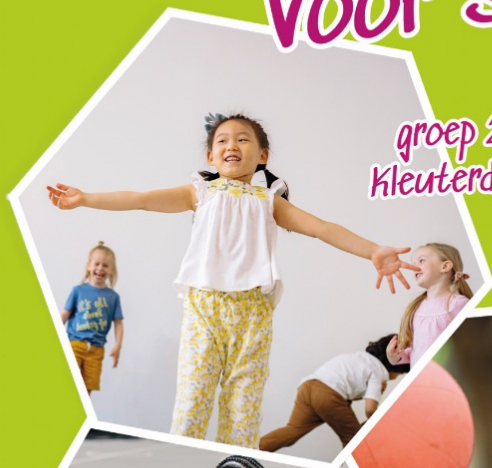
groep 2: Kleuterdans