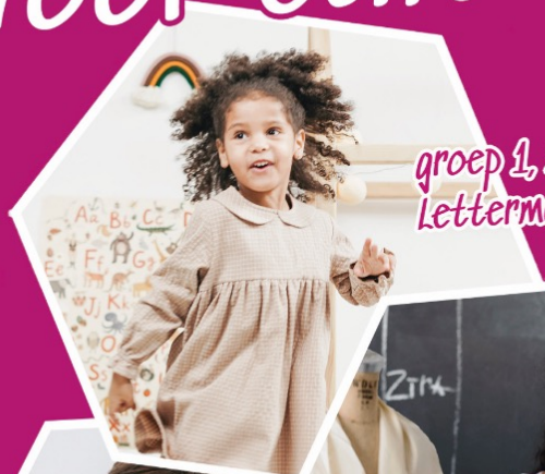
groep 1, 2: Lettermuziek