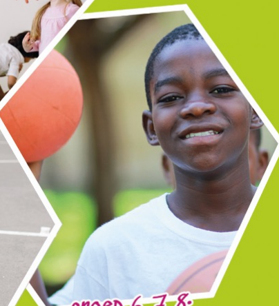
groep 6, 7, 8: Basketbal