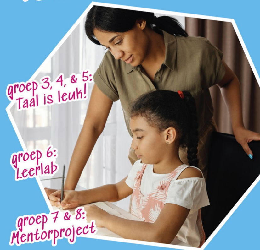
groep 3, 4, & 5: Taal is leuk!